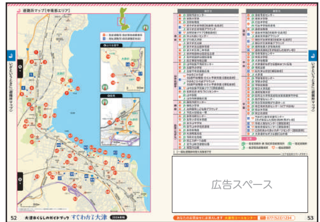
いざというときに (避難所マップ)