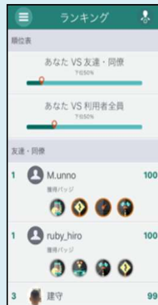
ランキング・バッジ獲得