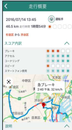
安全運転のヒント