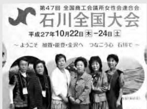
大津からの参加者

「ようこそ 加賀・能登・金沢へ つなごう心 石川で」をテーマに石川県で行われた標記大会には341女性会から3,200名を超えるメンバーが集結し、交流を促進する大会となりました。